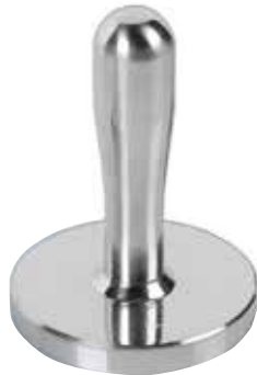
SAP1060010 / SAP1060020