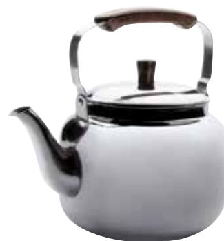
LR68215 / LR68205

Bollitore acciaio inox per induzione | Stainless steel kettle for induction | 4 l