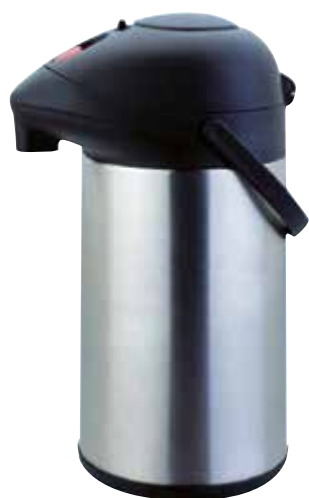
LR62472 / LR62475