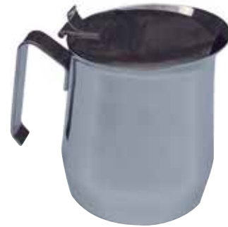
LS0052001 / LS0052024

Caffettiera a servire serie Jolly acciaio inox 18/10 Stainless steel coffee pot Jolly | 200 cl