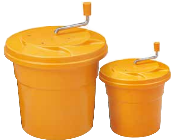
PD49888-20 E PD49888-10

Centrifuga manuale insalata Manual salad spinner | 4 l