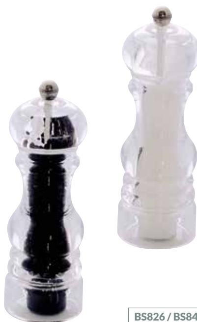
BS826 / BS8420S

Macinasale acrilico Classico Salt mill Classico | 18 cm