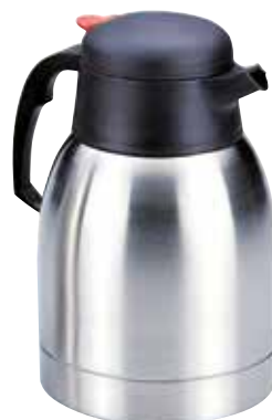
LR62481 / LR62486