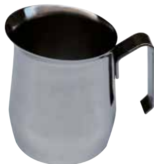
LS0054001 / LS0054024

Lattiera serie Jolly acciaio inox 18/10 Stainless steel milk jug Jolly | 200 cl